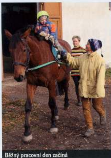
Běžný pracovní den začíná

V současné době máme pro klienty dva valachy, jednoho hřebece a klisnu. Gulliver je osmiletý anglický plnokrevník, kterého jsme zakoupili asi před čtyřmi lety. Je velice spolehlivý, má velkou empatii pro klienty, ale pokud ho mám pod sedlem, popustí uzdu svému temperamentu. Druhým koněm je Dan, slezský norik, čtrnáctiletý. Původně chodil pracovat do lesa, poté sloužil jako voltižní kůň. V boxu je nepřijemný, ale jinak mu přezdváme workoholik! Stále potřebuje pracovat, je velice spolehlivý a klidný, může být využit jak při hipoterapii, tak při léčebném pedagogicko - psychologickém ježdění (LPPJ) a také pro rekreační ježdění handicapovaných. Dále máme šestiletou klisnu Lyru, je plemene slovenský teplokrevník. Přišla k nám jako nedotčená, postupně jsme s ní začali pracovat a teď nám vrací, co jsme do ní vložili. Zatím chodí hipoterapie, v budoucnu bychom ji chtěli využít i pro LPPJ. Od pana Korába máme pronajatého hřebece Tranzita (bývalý vynikající dostihový kůň, anglický plnokrevník, 19 let), který má naprosto jedinečný pohyb hřbetu, který pomáhá zejména klientům s neurologickými potížemi. Tento hřebece nejprve sloužil dětem na jízdárně, dokonce byl využíván i jako voltižní kůň a my si nyní velice vážíme možnosti s ním pracovat - je opravdu jedinečný! Posledním členem našeho týmu je mladinká (dvouletá) klisna Basia, kterou máme od naší zasloužilé klisny Bonety (ta si nyní užívá důchodu.)