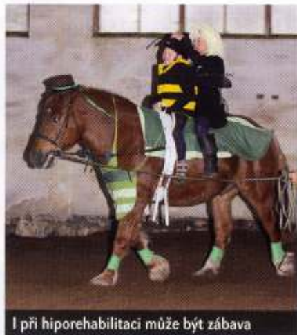
I při hiporehabilitaci může být zábava

dopředu a dozadu. Tyto pohyby plus rotace se přenášejí přes pánev sedícího klienta na jeho trup a vyvolávají tak