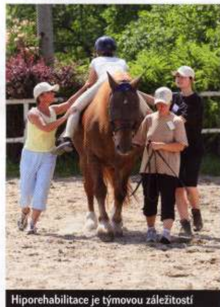
Hiporehabilitace je týmovou záležitostí