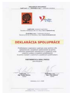
Lepší svet n.o., Bratislava