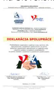
Autistické centrum Andreas, n.o., Bratislava