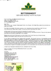
Bittersweet, Ohio, USA