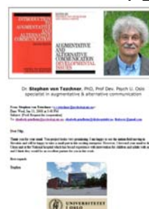
University Oslo, Nórsko